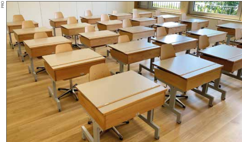
PRO fournit également les écoles du canton en pupitres et bancs.