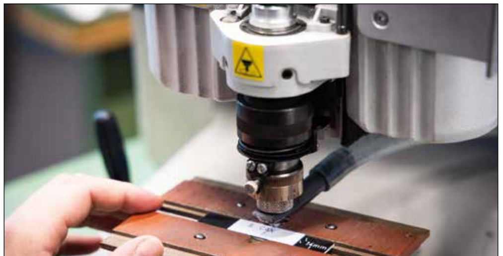
Environ 10 000 plaquettes de boîtes aux lettres sont préparées dans les ateliers de gravure.

Au sein des ateliers de PRO, les menuisiers s'affairent pour fabriquer du mobilier en tout genre: matériel scolaire, bibliothèques, armoires, étagères, cuisines, éco-points, coffres et coffrets, etc. Conçus et réalisés sur place, les éléments en bois (issus de forêts européennes, gérées de manière durable) sont ensuite livrés, montés et installés. L'entretien, la restauration ou la réparation sont également assurés par les équipes de PRO. Ces prestations globales sont très appréciées non seulement des particuliers, mais aussi des architectes, régies immobilières, entrepreneurs, artisans et collectivités publiques. «Les régies nous