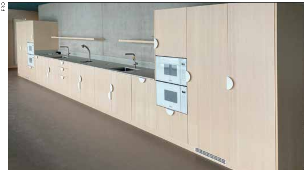
Tout travail est commercialisé selon une qualité qui répond pleinement aux exigences du marché.