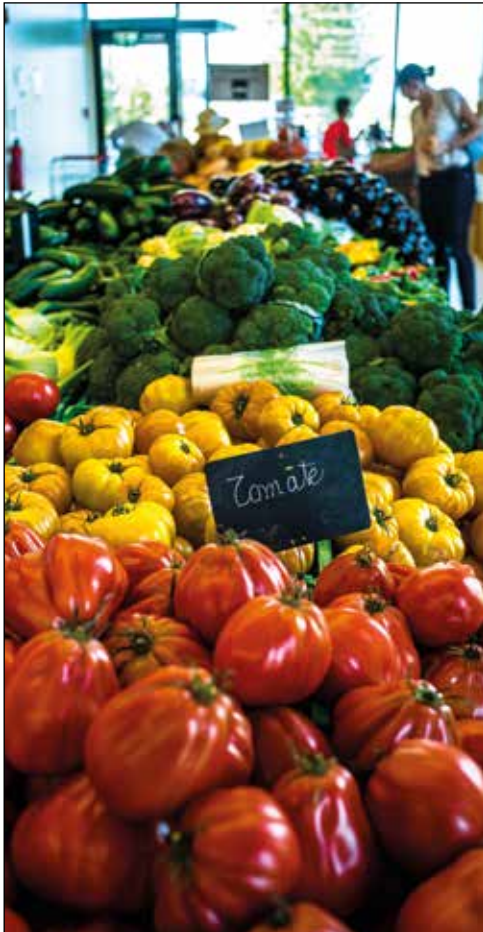
Magasin de l'UMG: des produits locaux et de saison.

voit de nombreux clients ayant souvent une connaissance plus affirmée de leur terroir ou cherchant à acheter en gros, les magasins des Pâquis et de Carouge cherchent à atteindre une clientèle citadine avide d'information sur les produits qu'elle achète.