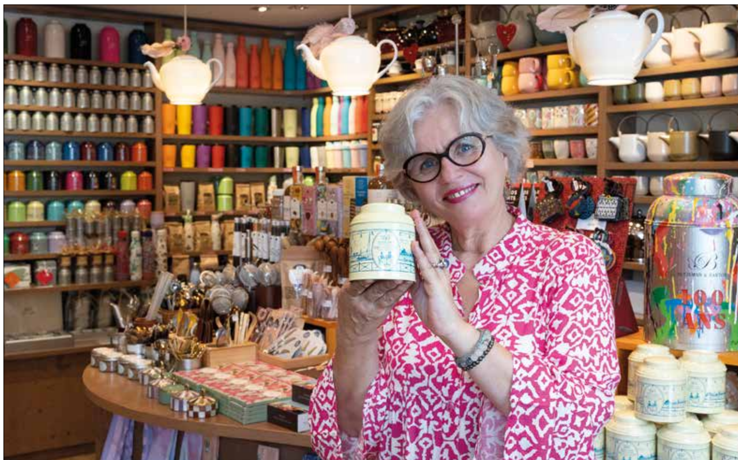
BETJEMAN & BARTON

A Carouge/GE, la boutique de thés Betjeman & Barton fête ses 30 ans. Un événement célébré par la création du Geneva Tea Amore, un thé aussi élégant que gourmand, et par plusieurs événements.