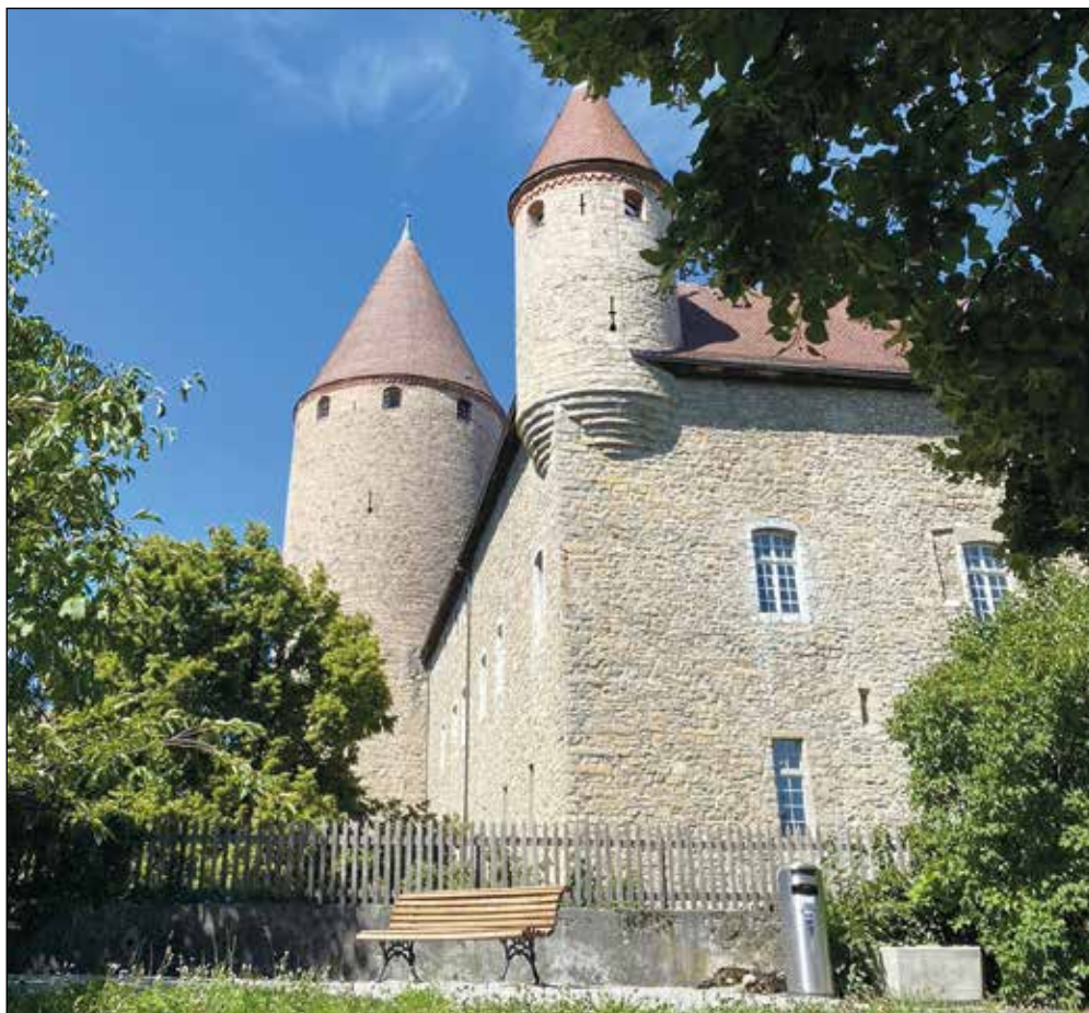
Construit à la fin du XIII e siècle, le château de Bulle est une pièce maîtresse de l'urbanisme du centre-ville de Bulle.

Le déménagement de la Préfecture dans le Velâzdo de Bulle, installée dans les nou-