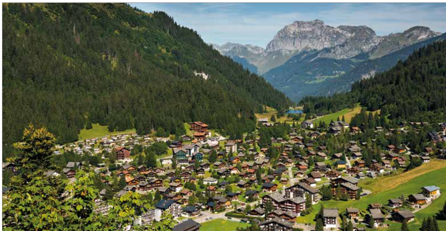
Un paysage de carte postale.

travaux ont été effectués en 2023, afin notamment d'assainir la centrale et de revoir le système de traitement des fumées. Cela dans le but d'assurer la poursuite du développement de ce réseau, l'objectif étant de passer de 70 bâtiments actuellement reliés à 130 à terme.