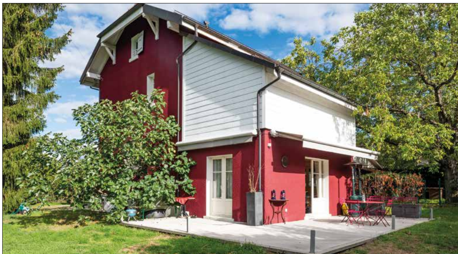
DÉSORMIÈRE & VANHALST

Le vieillissement de la population est une évolution démographique incontestable. En outre, la prévalence à la maladie d'Alzheimer et autres formes de démence progressent en fonction de l'âge. D'après les estimations actuelles, quelque 153 000 personnes (315 400 en 2050) sont concernées en Suisse par ce mal sournois, les femmes étant davantage prédisposées. Si la maladie d'Alzheimer est plutôt associée au grand âge, une proportion non négligeable a moins de 65 ans, voire beaucoup moins. Notre société n'est pas prête à faire face à ces défis, en particulier lorsque les premiers stades de la maladie se manifestent.