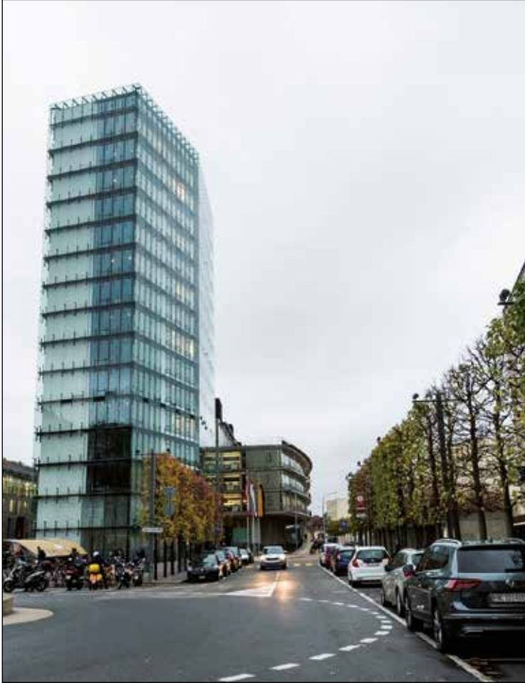
ARCHIVES LUCAS VUITEL