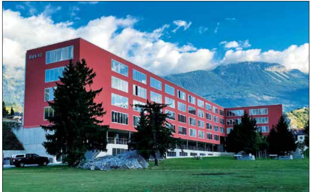
Sierre: la Haute Ecole de Travail Social entend favoriser l'accès aux études pour les réfugiés.

Les quatre directeurs et directrices de l'ouvrage, membres du Lasur, ont demandé à des expertes et experts en sciences sociales d'écrire un chapitre sur une ville de moins de 60 000 habitants dans laquelle ils ou elles ont longtemps habité. Les douze lieux sélectionnés devaient se trouver dans les quatre régions linguistiques et suffisamment éloignées de l'orbite des grands centres urbains comme Zurich ou Genève. Ont été re-