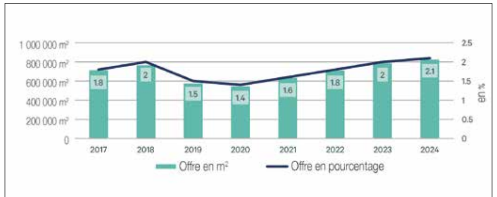
Offre de surfaces d'activité.

L'augmentation de l'offre à 826 000 m 2 de surfaces d'activité pour l'industrie légère peut être attribuée, entre autres, à l'environnement de taux d'intérêt bas depuis plus de dix ans. Il a encouragé les promoteurs à investir dans des bâtiments d'activités à usage mixte pour l'industrie légère. Des immeubles de ce type se développent progressivement en Suisse, notamment dans l'agglomération de Zurich, suivant en cela le modèle genevois des «hôtels industriels» qui font déjà partie intégrante de la structure du marché régional. Du côté des locataires, cela se traduit par des choix plus variés, même si les cibles d'utilisateurs plus traditionnels et à faible marge n'ont pas