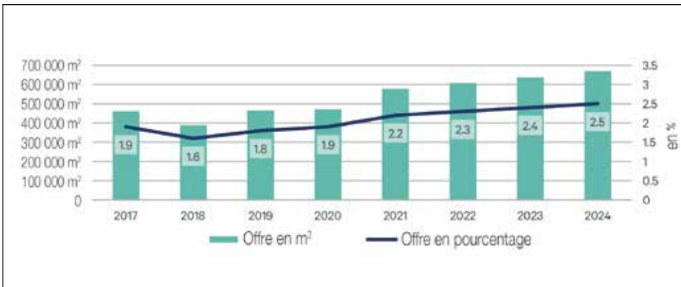
Offre de surfaces logistiques en Suisse - 2017-2024.

- qui a accueilli récemment une forte activité de construction -, Berne et Argovie. Les loyers demandés ont continué à augmenter (en particulier dans le segment haut de gamme) et s'élèvent désormais à 120 CHF/m² par an en médiane (contre T3 2021: 110 CHF/m² par an). Le taux de rendement prime (net) est actuellement de 4,25%, soit 60 points de base de plus qu'il n'était au deuxième trimestre 2022, juste avant que la Banque nationale suisse (BNS) ne resserre sa politique monétaire en réhaussant ses taux directeurs de 225 points de base au cours des deux dernières années. ►