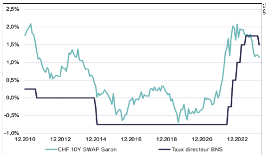
Taux d'intérêt à court et long termes.

Les comptes annuels publiés au 31 décembre 2023 révèlent que l'augmentation du taux d'intérêt sans risque a été largement anticipée, entraînant principalement des dépréciations modérées. Selon Wüest & Partner et