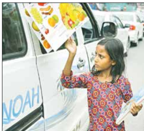
Jamais élève mais riche d'infos.