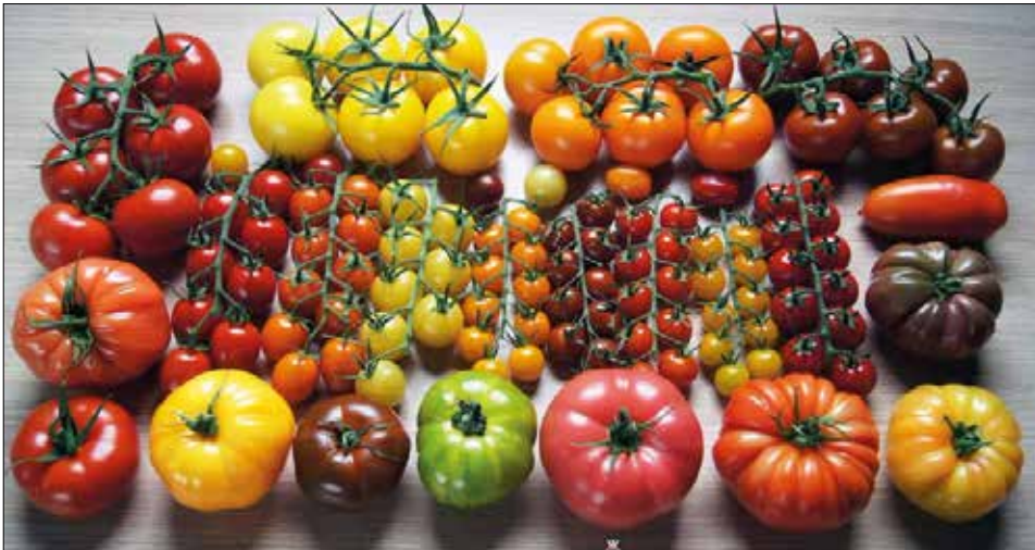
Les belles tomates des Mattines!