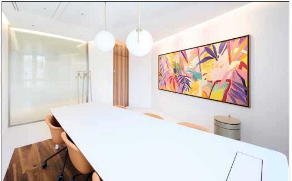
Les salons sont aménagés avec soin et agrémentés d'œuvres d'art.