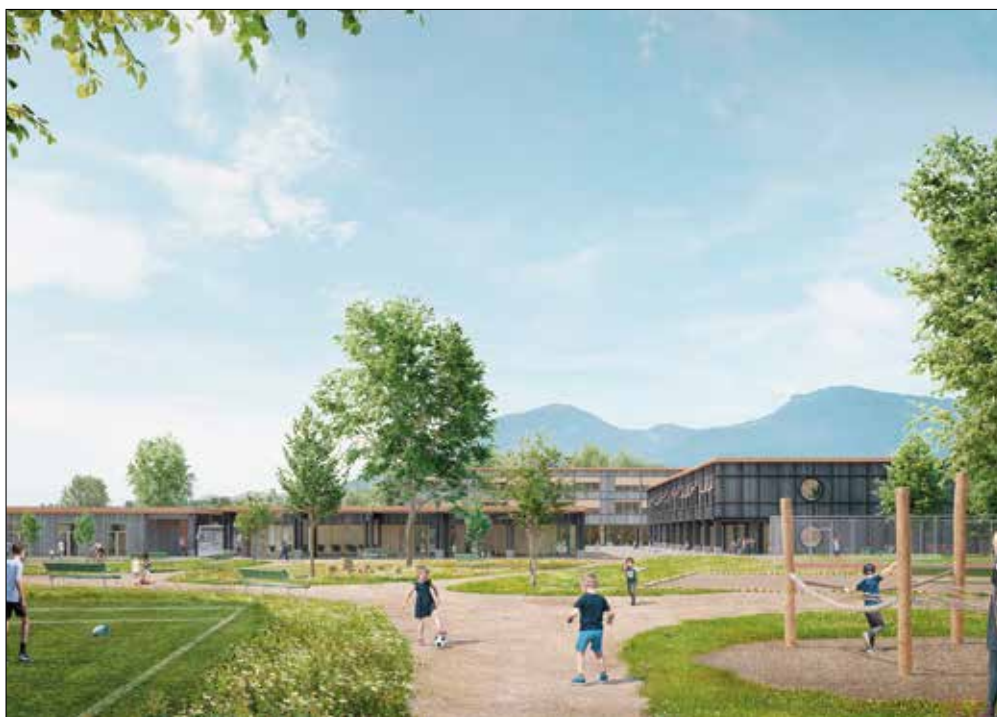
Le futur centre scolaire et sportif.

centre du village est alimenté par un chauffage à distance depuis une quinzaine d'années. Le projet, avant-gardiste à l'époque, avait été lancé par un groupe de propriétaires afin de limiter la dépense de CO 2 . Nous avons également fait le choix de peu traiter les végétaux et de créer des zones favorisant la biodiversité. La nature est libre de reprendre ses droits dans les endroits qui s'y prêtent. Par ailleurs, depuis 2011 déjà, nous plantons uniquement des espèces indigènes et des plantes adaptées au changement climatique.