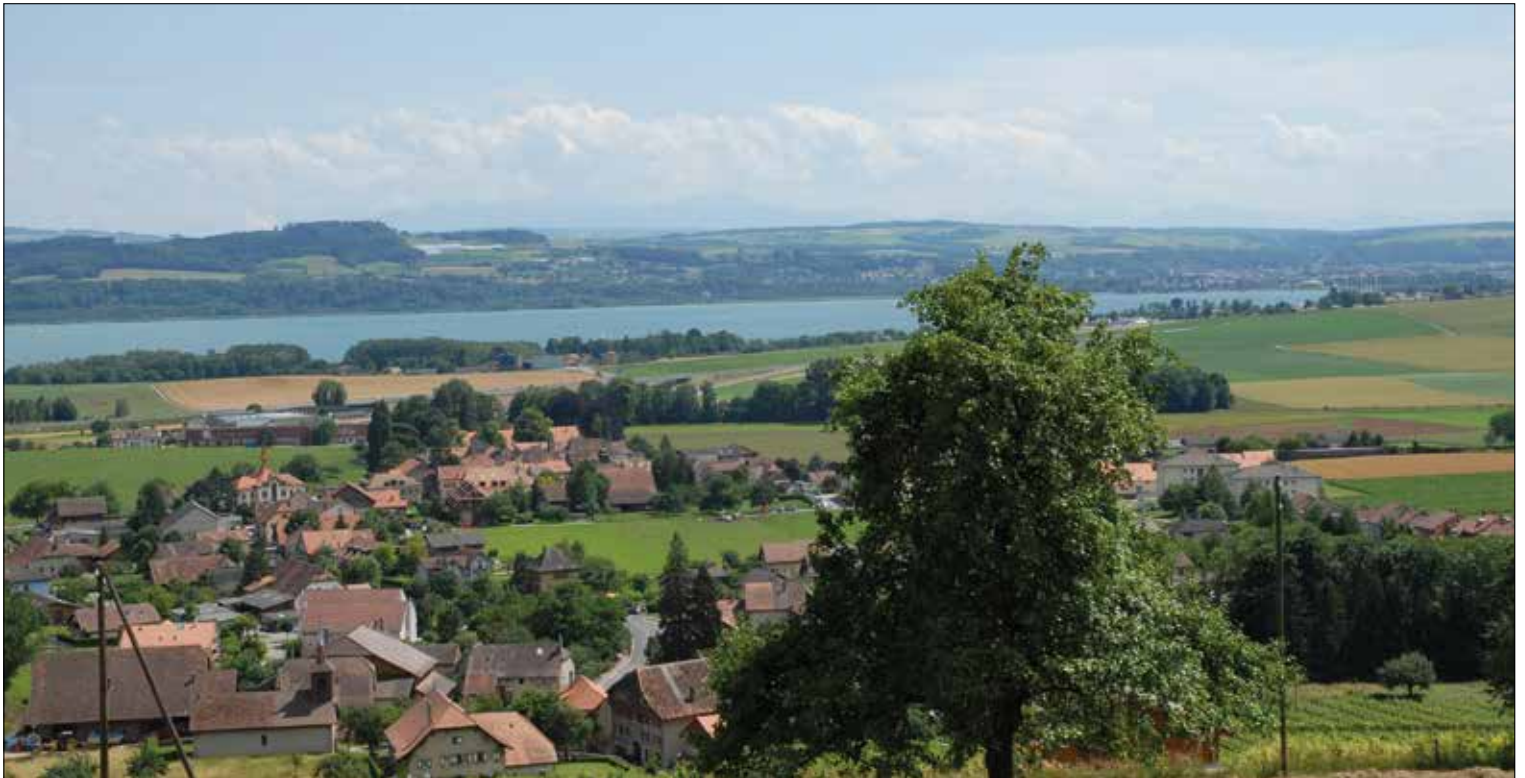
Un beau dégagement sur le lac et les vignes de Champagne.

habitants au cours des dix prochaines années. Par ailleurs, dans un village classé à l'Inventaire ISOS, il faut être conscient que la marge de manœuvre est réduite.