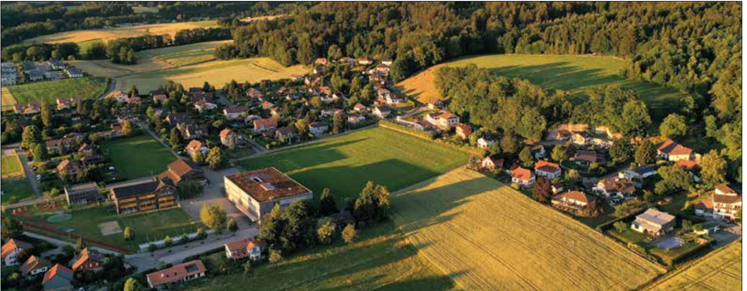
La riante campagne vaudoise.

cadence au quart d'heure; la seconde relie Cugy au Mont-sur-Lausanne et à la gare de Renens, avec une cadence à la demi-heure. Il s'agit d'une ligne récente, mise en place il y a trois ans et destinée à se développer à l'avenir en direction d'Epalinges (Clochatte) avec une cadence plus élevée.