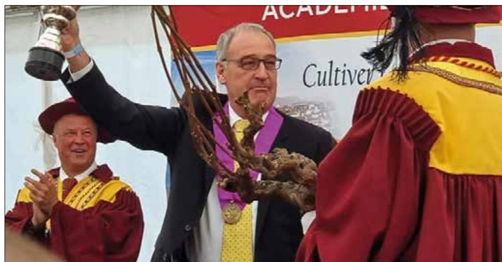
En septembre 2021, la confrérie accueille et intronise membre d'honneur le président de la Confédération en fonction, Guy Parmelin.

quais du lac - qu'à la Journée des confréries de la Fête des Vignerons de Vevey. Ces huit dernières années, une délégation participe, comme membre du jury, au Concours des vins de France de Mâcon. En septembre 2021, elle accueille et intronise membre d'honneur le président de la Confédération en fonction, Guy Parmelin. Le 70 e