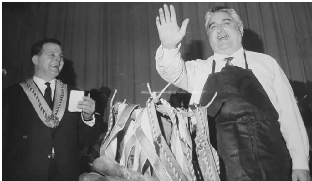
ACADÉMIE DU CEP

Devançant les agitations européennes de l'année 1968, l'Assemblée Générale de fin janvier décide à l'écrasante majorité (52 oui, 6 non) de devenir indépendante de l'Association nationale des amis du vin, créée en 1950, qui n'a, dès lors, plus de section dans le canton de Genève. En cette année de XV e anniversaire, l'Académie tient son vingtième Chapitre: le mois de novembre de 1968 est donc doublement festif. La décennie s'achève sur un voyage printanier de trois jours en Champagne. Les années septante accentuent l'ouverture sur le monde et sur la Suisse. Les excursions se font tant en Bourgogne et dans le Beaujolais (1974) qu'à Gstaad (1976). La Fête des Vignerons