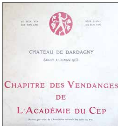
Premier Chapitre de l'Académie du Cep, en 1953.

nomes des châteaux du Val de Loire (1990). En octobre 2013, l'Académie du Cep célèbre son 60 e anniversaire lors d'une soirée à l'Hôtel Intercontinental à Genève, en présence de nombreuses confréries amies venant de toute la Suisse romande. En 2019, la confrérie participe aussi bien à la Journée genevoise - notamment au cortège officiel sur les