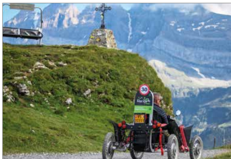
La montagne vécue différemment au volant d'un Swincar.