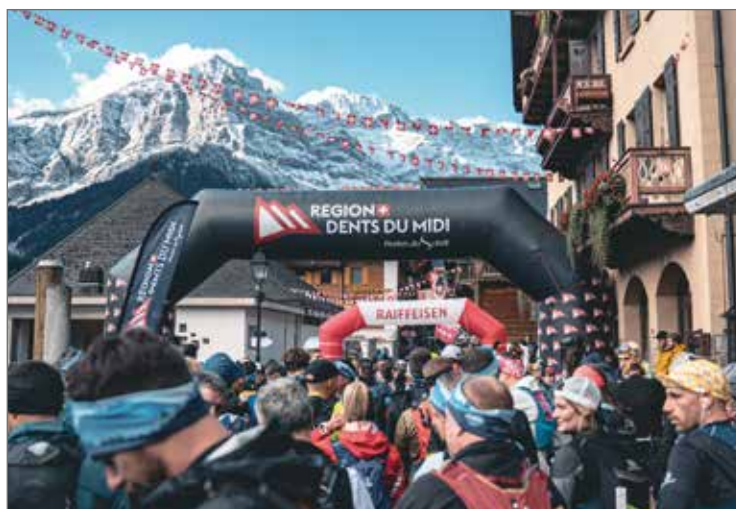
Le Trail des Dents du Midi est un événement compétitif et sportif.

aux remontées mécaniques équipées pour le transport de VTT.