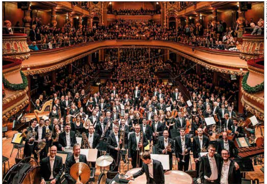
Un orchestre symphonique professionnel tel que l'OSR tient du prodige et du soutien de mécènes, d'institutions publiques et privées.