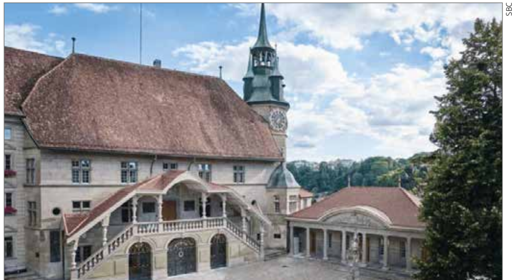
Une rénovation parfaitement réussie.

Fermement campé sur son éperon rocheux au cœur de la ville historique, l'Hôtel-de-Ville de Fribourg a concentré en ses murs pluricentennaires la plupart des fonctions régaliennes de la Cité-Etat dont il était le centre politique et judiciaire. Aujourd'hui, il