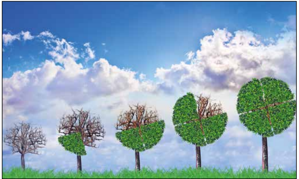
Une formation en progression croissante, axée sur la transition durable.

d'accélérer cette transition verte: les établissements financiers, les asset managers , l'ONU, les ONG et autres organisations internationales, auxquels s'ajoutent un secteur académique de pointe, de grandes fondations privées et des autorités politiques engagées. C'est aussi à Genève qu'a été lancé, en 2019, Building Bridges, l'initiative conjointe des partenaires suisses et internationaux pour un modèle économique durable, qui tiendra son troisième sommet dans la cité en octobre prochain».