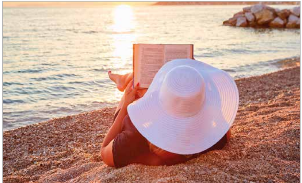
L'été, saison de lecture par excellence...

écrites et pleines d'esprit, avec des indications pratiques, afin de ne rien manquer. A la fin du livre, un palmarès des dix principales merveilles dans quinze catégories (plus belles îles, plus beaux sites antiques, plus beaux villages, etc.) est proposé. Enfin, le livre est d'un format pratique et l'éditeur est parvenu à le rendre résistant et facile à emporter avec soi. Un compagnon indispensable! (Th.O.)