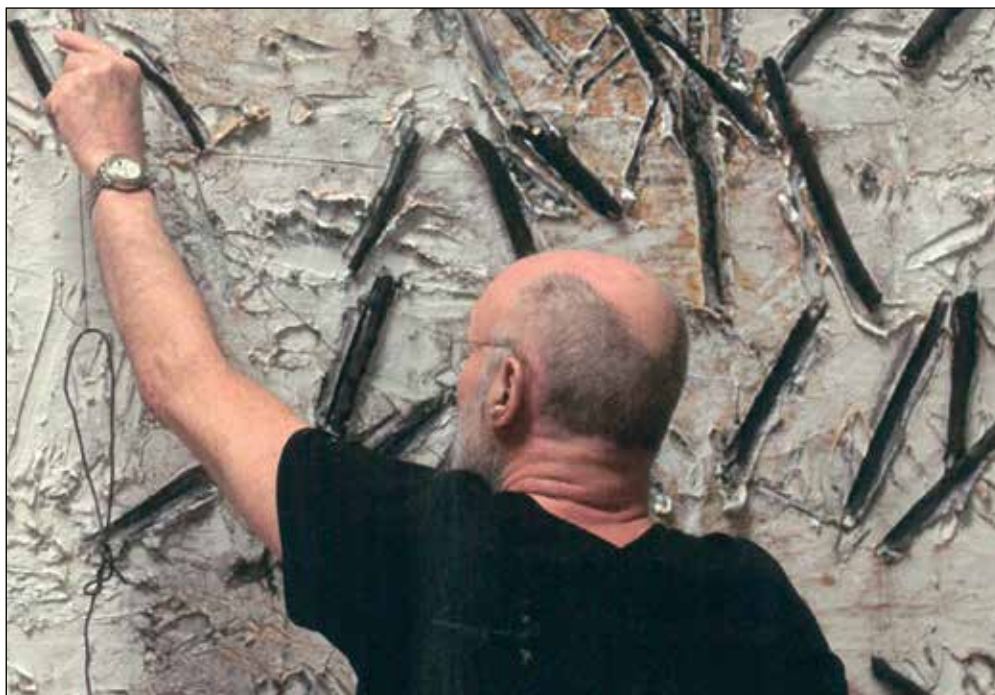
CHARLES DUPRAT © ANSELM KIEFER

Avec l'été qui arrive, c'est aussi la nouvelle édition de la revue trimestrielle «L'Information Immobilière» qui vient de paraître. Il y a de quoi lire, s'émerveiller, réfléchir, rêver, s'indigner, bref de quoi passer par tous les plaisirs et par toutes les émotions au fil des 200 pages qui parlent aussi bien d'art et d'architecture que de politique et d'histoire.