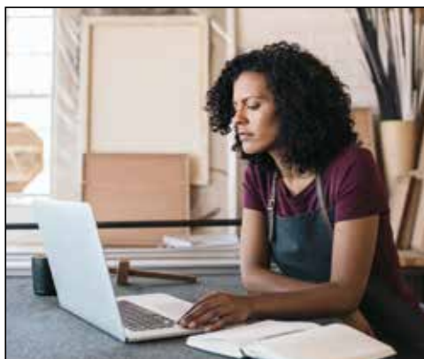
L'étude PME 2022 donne un aperçu de la diversité du paysage suisse des PME.

Pas moins de 99,7% des entreprises de Suisse sont considérées comme des PME selon les derniers chiffres provisoires de l'Office fédéral de la statistique. Les micro-entreprises, qui emploient moins de dix personnes, constituent la forme la plus fréquente de PME, avec près de 90% des firmes. Les deux autres formes de PME, à savoir les petites et les moyennes proprement dites, ne représentent ensemble qu'une entreprise sur dix en Suisse: 8,4%