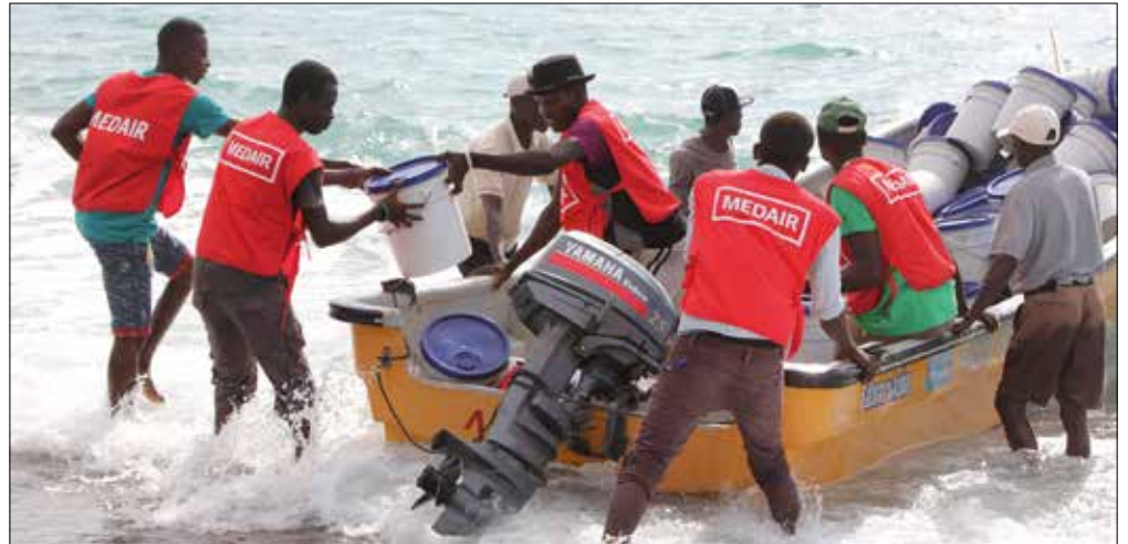
L' action de Medair est tournée vers une douzaine de pays et axée sur les populations les plus pauvres.

- Voilà deux ou trois ans que les paroles résolues du Saint-Père - qu'il s'agisse de l'encyclique Laudato Si ou de Fratelli Tutti , ou encore de ses homélies et discours