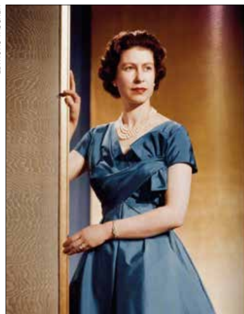
«Her Majesty», a photographic history 1926-today, par Reuel Golden (éd.), Editions Taschen 2020.

de cette saga des Windsor. Une saga qui intéresse encore Jean des Cars, qui vient de publier une nouvelle version de son livre paru en 2011 «La saga des Windsor». On le voit, la Reine et sa famille sont loin de dé-