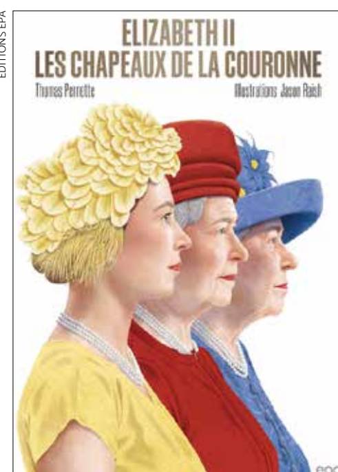
«Elizabeth II, les chapeaux de la Couronne», par Thomas Pernette, Editions EPA 2021.