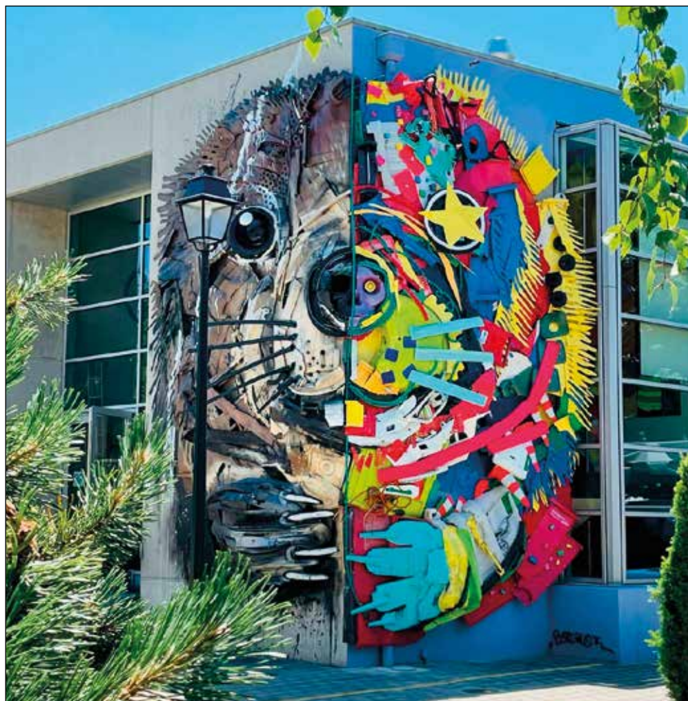
Si vous passez par la route de Chancy, vous apercevrez le joli minois du Half baby beaver!