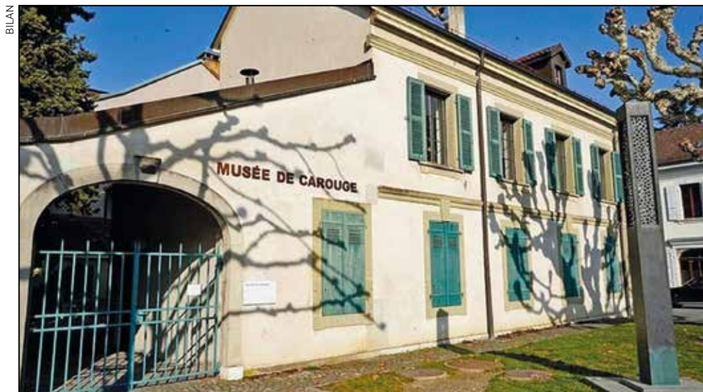
Un musée tout neuf pour la Ville royale.

quer le poète René-Louis Piachaud (à qui la mode des temps vient de voler sa rue dans la Vieille Ville de Genève) ou Henri Tanner, peintre et écrivain.